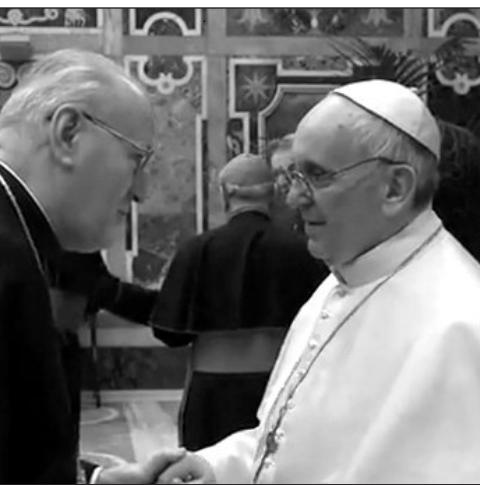
Erdő Péter bíboros, esztergom–budapesti érsek köszönti Ferenc pápát

Egyértelműen a hagyományos felfogást hirdeti a szexuális erkölcsök tekintében, hevesen ellenzi az abortuszt, az azonos neműek közötti házassági kapcsolatot. 2010-ben gyerekekkel szembeni diszkriminációnak nevezte, hogy a meleg párok gyerekeket fogadhassanak örökbe. Tavaly szeptemberben hevesen kritizálta azokat a papokat, akik nem voltak hajlandók házasságon kívül született gyerekeket megkeresztelni.