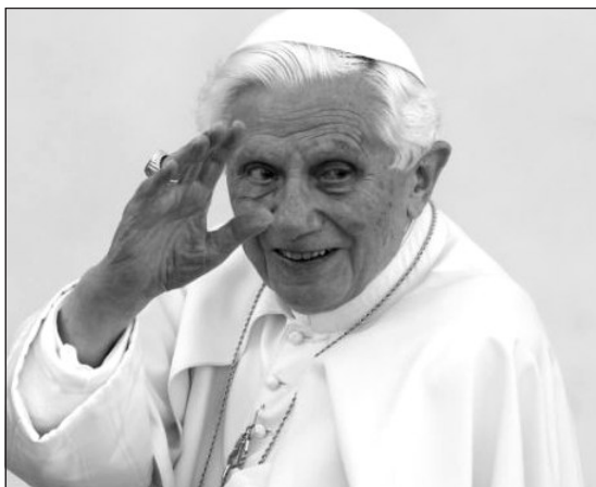
XVI. Benedek pápa február 28-án fejezte be péteri szolgálatát

Szeretnék visszatérni 2005. április 19-éhez: döntésem súlyosságát az jelentette, hogy ettől a naptól kezdve mindig és mindörökre az Úr szolgálatába álltam. Mindig, mert aki a péteri szolgálá-