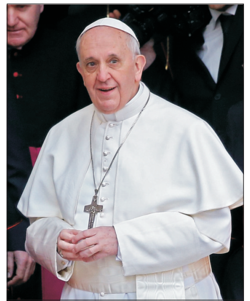
A konklávé Jorge Mario Bergoglio bíborost, Buenos Aires érsekrét választotta pápává

Azt kívánom, hogy ez az út, amit ma elkezdünk az Egyházban, és amelyben engem az itt jelen lévő bíboros helynö-