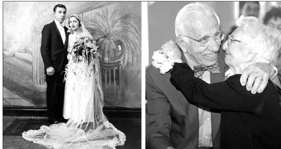
Az ifjú és az örökifjú pár