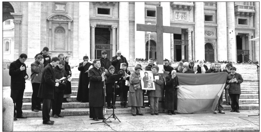
Római magyarok – a Pápai Magyar Intézet közössége, a Collegium Germanicum et Hungaricum növendékei, szerzetesnők és más egyházi személyek – együtt imádkozták a rózsafüzért a Hit évéhez kapcsolódva február 20-án délután 4 órakor a római Szent Péter téren. Az eseményt a Telepace és a Vatikáni Televízió élőben közvetítette