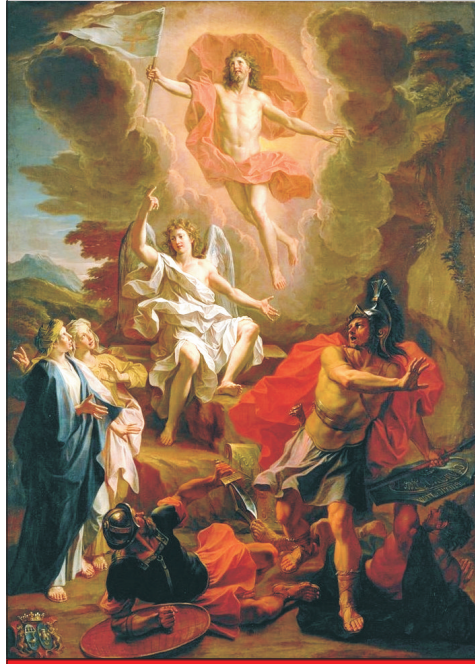
Feltámadás Noel Coypel festménye (1700)

MINDEN OLVASÓNKNAK ÁLDOTT HÚSVÉTI ÜNNEPEKET KÍVÁNUNK!