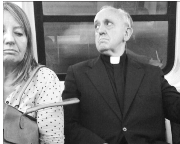
Bergoglio bíboros munkába menet. Az interneten közzétett felvétel a Buenos Aires-i metrón készült

Az első pápa, aki nem a saját nevét használta Róma püspökeként, az 533-ban megválasztott Mercurius volt, aki úgy vélte: az Örök Város keresztény főpapja nem viselheti egy pogány római istenség (a kereskedelem és a tolvajok istenének, Merkúrnak a) nevét, így elrendelte, hogy II. Jánosnak nevezzék. A ke-