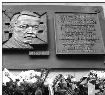
A Szép utcai emléktábla

A megemlékezést az Eötvös Loránd Tudományegyetem Bölcsészettudományi Karán folytatták, ahol Esterházy-emlékplakettet és elismerő oklevelet adtak át olyan személyek és intézmények részére, akik és amelyek a felvidéki magyar közösség szolgálatában kiemelkedő tevékenységet fejtettek ki, illetve gróf Esterházy János mártír sorsú politi-