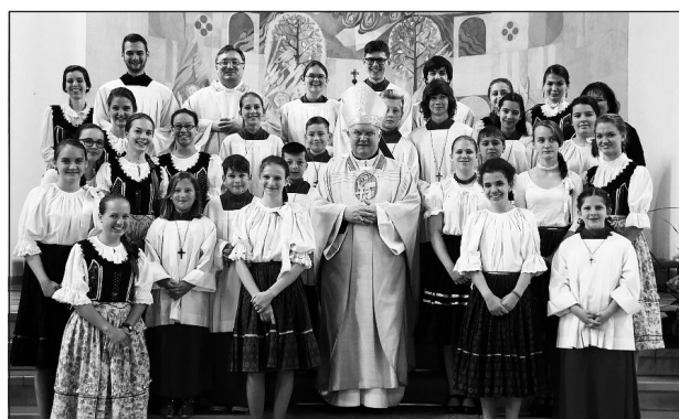
Püspöki látogatás Augsburgban

A Szent László Magyar Katolikus Misszió aktív hitéleti, kultúraszervezői tevékenységet folytat az augsburgi Szent Márton Plébánián. Magyar iskolát működtetnek, hogy az ott élő gyerekek megtanuljanak magyarul írni, olvasni, magyar környezetben a magyar kultúra-