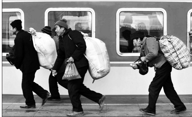
A hit legyen erősebb minden különbözőségnél

Napjainkban a bevándorlókat egyre inkább gyanúval, bizalmatlansággal és elítéléssel, vagy egyenesen ellenségesen fogadják. Még azon emberi drámákra is, amelyek a hírműsorokon keresztül eljutnak földrészünk lakóihoz, úgy tú-