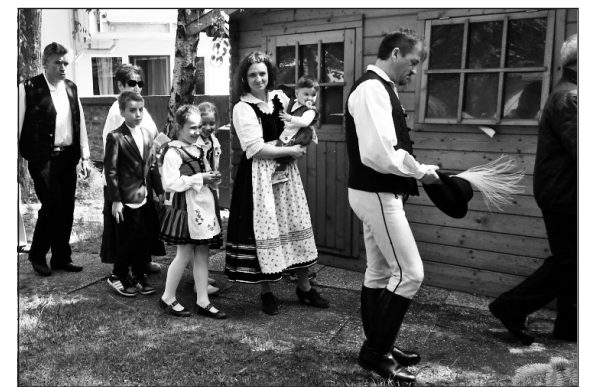
Öröm volt látni a sok gyermeket, fiatalot

Szentbeszédében a vendégszónok Bécsbe varázsolta Erdélyt, amikor arról beszélt, hogy a szépvízi plébánia udvaráról a négy égtáj felé irányítva tekintetét,