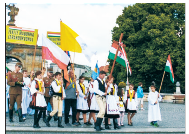
Magyar zarándokok Częstochowában